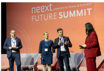
Initiative „neext Future Summit“ von Drees & Sommer und Holtmann+