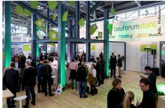
Bauforumstahl e.V. mit ihrem Messeauftritt auf der „Bau 2023“ in München.

Der Aufbau von Communitys sowie das Etablieren und Stärken von Netzwerken rückt vermehrt in den Fokus. Die Besucher wollen Plattformen, um innerhalb der sich schnell transformierenden Welt über diese Themen ins Gespräch zu kommen. Es geht dabei um Networking, den intensiven Austausch innerhalb der Branchen und die Diskussion über potenzielle Herausforderungen und den dazu passenden Lösungsansätzen.