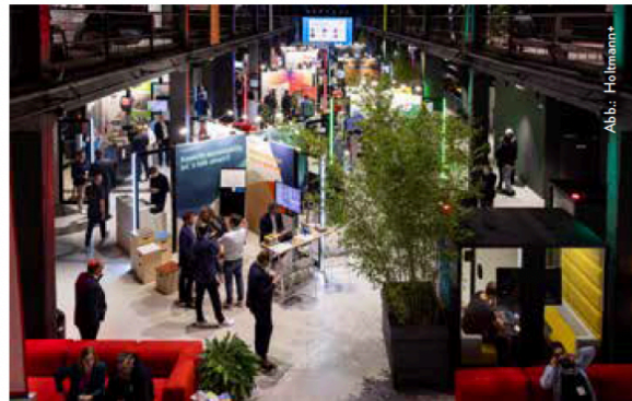
Circular Design, Building and Construction Summit der Designing-the-Future-Initiative 2023.

Im Oktober 2023 durfte das Unternehmen seinen Kunden Drees & Sommer als Partner und Visionsträger zum zweiten Mal bei der Designing-the-Future-Initiative unterstützen. Der Höhepunkt mündete im Circular Design, Building and Construction Summit. Die Vision bestand darin, ein ganz neues Veranstaltungsformat für die Bau- und Immobilienwirtschaft auf die Beine zu stellen. Die Initiative hob das klassische Event auf ein neues Level und legte den Fokus auf Innovationen und zukunftsfähige Lösungsansätze für eine nachhaltige Bau- und Immobilienentwicklung. Das Format bot Raum für Diskussionen, Impulse, Workshops und Ausstellungen – ein echtes Paradebeispiel für Networking und Community Building.