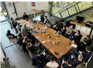
Nachhaltigkeitsworkshop bei Holtmann+

Holtmann+, Full-Service-Anbieter in der Livekommunikation aus Langenhagen/Hannover, übernimmt Verantwortung gegenüber zukünftigen Generationen und ergreift entsprechende Maßnahmen, um einen zukunftsfähigen Einklang aus Ökonomie, Ökologie und Sozialem zu schaffen. Wie das geht und was zu tun ist, hat das Unternehmen in einem Workshop erarbeitet.